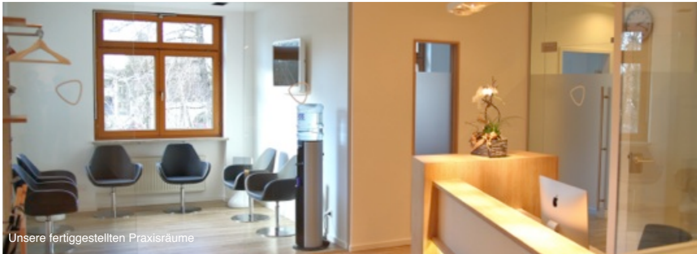
Unsere fertiggestellten Praxisräume